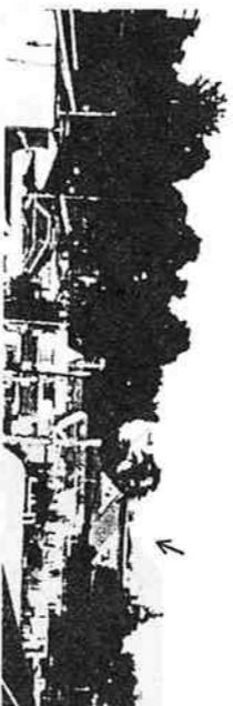
高台から養玉院如来寺を望む

諏訪神社の脇の道を少し上るとこの辺りで一番高い見晴らしのよい場所へ出ます。この高台から北に向かって下る